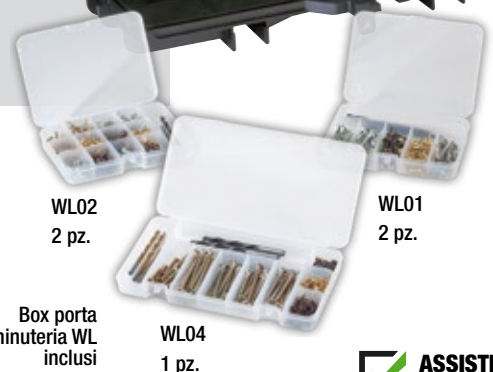
WL02 2 pz.

AIBOX - organizer con coperchio removibile semi-trasparente. Disponibili in tre altezze, 30, 60 e 95 mm. e in diverse configurazioni interne.